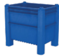
Longueur spéciale SL-600