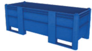
Longueur spéciale SL-2160