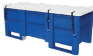
Longueur spéciale SL-1905