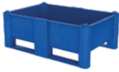
Hauteur spécial SH-440

D'autres options de dimensions et d'accessoires sont disponibles sur demande.