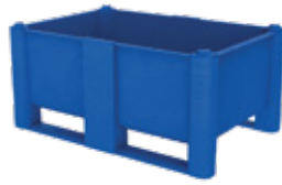
Hauteur spécial SH-540