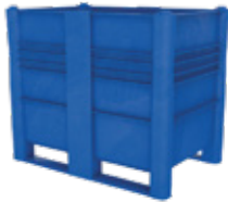
Hauteur spécial SH-1000